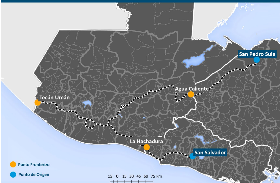
RUTA DE PERSONAS MIGRANTES EN TRÁNSITO 16-01-2019