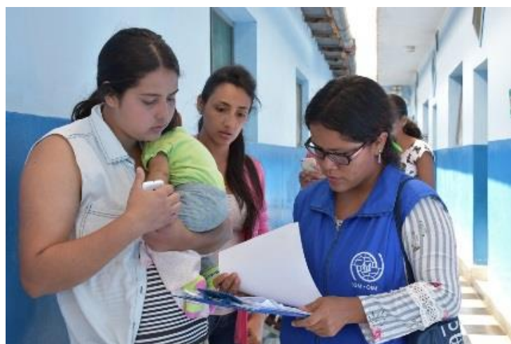
Asistencia a venezolanos con alojamiento temporal en Tumbes (Perú)

Durante el período reportado, la OIM ha adelantado los acuerdos operativos con los gobiernos involucrados, las organizaciones de la sociedad civil, el ACNUR, UNICEF, la Organización Panamericana de la Salud y otras agencias de Naciones Unidas para aumentar la cobertura y acelerar la provisión de asistencia directa a los venezolanos que se encuentran en situación de vulnerabilidad.