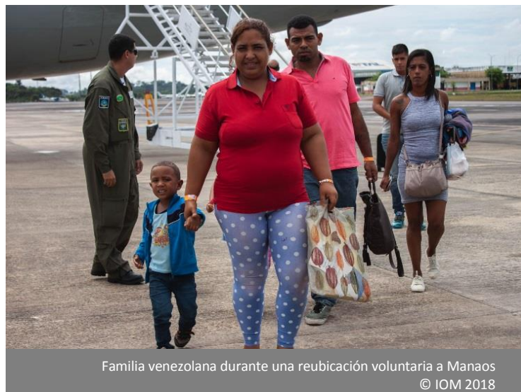
Familia venezolana durante una reubicación voluntaria a Manaus

lanzada en sociedad con el Directorio General de Migración y con el Consejo Nacional de Migración, ha asistido a 280 nacionales de Venezuela en Costa Rica con información acerca de cómo acceder a los servicios sociales y de integración. Todo ello funciona juntamente con el Centro de Referenciación para Migrantes que ya ha asistido a 298 venezolanos (58 familias) en San José, que necesitaban ser guiados respecto de los mecanismos de regularización y servicios de salud.