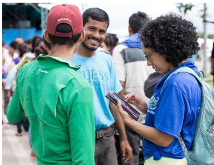
Entrevista de la DTM en Roraima @IOM 2018

Durante el período reportado, los equipos de la OIM completaron rondas de implementación de la DTM en Brasil , Ecuador 1 and Perú 2 , con las cuales se pudo llegar hasta 7.871 personas: 3.785 en Brasil ( Boa Vista y Pacaraima ), 2.450 en Ecuador ( Quito , Huaquillas y Rumichaca ) y 1.636 en Perú ( Lima , Tumbes y Tacna ). En Argentina y Chile las operaciones para la recopilación de datos han terminado y el procesamiento y análisis de datos se está realizando en este momento, mientras se recopilan datos de línea de base y se realizan entrevistas en Costa Rica , Colombia , República Dominicana (juntamente con el ACNUR), Ecuador (ronda 2), Guyana , Panamá (en sociedad con el ACNUR, UNICEF, OPS/PMS y con la OEA) y Perú (ronda 4).